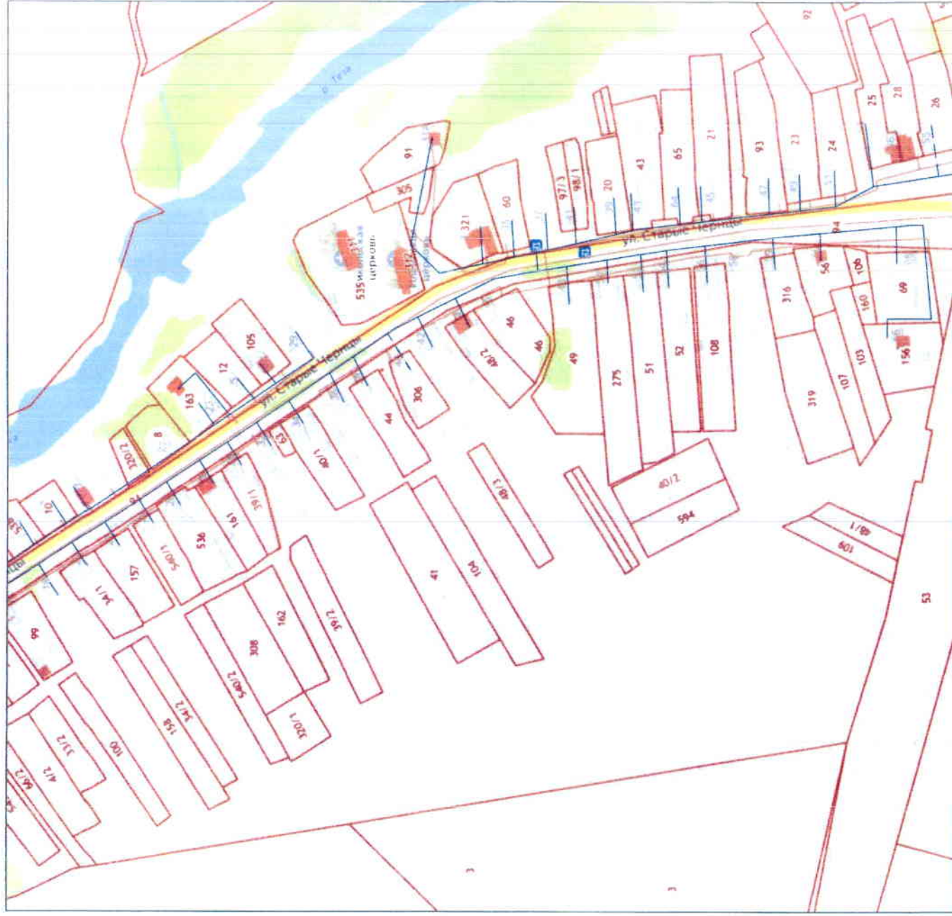
Схема газоснабжения с. Чернцы Старые Шуйского муниципального района